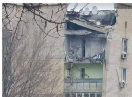
Рис.3 Руйнування жилого фонду