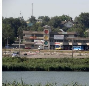
Рис.1 Архівні фото міста