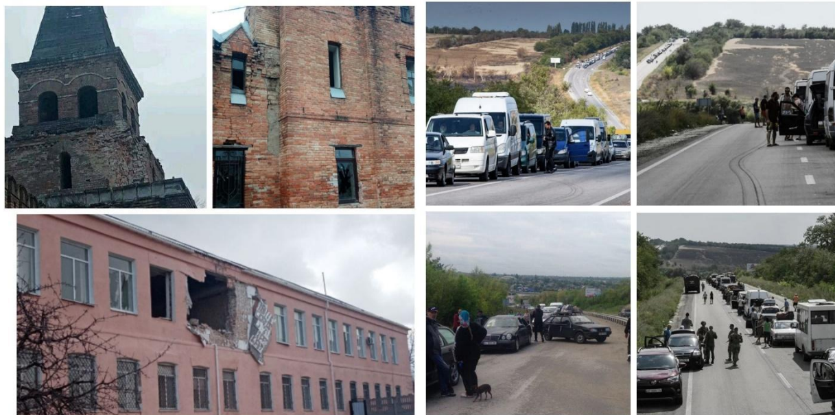
Рис.5 Руйнування у Садибі Попова Рис.6 Черги з автівок на виїзд

У травні-червні 2022 року Василівка стала кінцевим пунктом, в якому перебували люди перед виїздом на вільну територію. Проте, якщо на початку окупанти пускали достатню кількість машин, то вже ближче до вересня окупанти ввели односторонні перепустки на виїзд з окупації. А пізніше – взагалі закрили дорогу через Василівку. Про знущання окупантів над людьми на блокпостах можна написати окремий підручник. Люди могли тижнями жити без їжі, води та нормального туалету. Жінки народжували дітей в машинах. У черзі на виїзд з окупованої території померло 10 осіб.