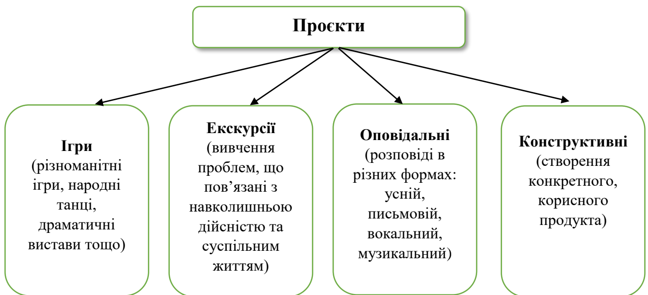
Рис.1. 2.1. Типологія навчальних проєктів за Е. Коллінгсом

Аналіз психолого-педагогічної та спеціальної літератури з теми дослідження дає широке уявлення про класифікацію проєктів за різними критеріями. У 1910-ті рр. американський учений Коллінгс, організатор тривалого експерименту в одній із сільських шкіл штату Міссурі, запропонував найпершу класифікацію навчальних проєктів: