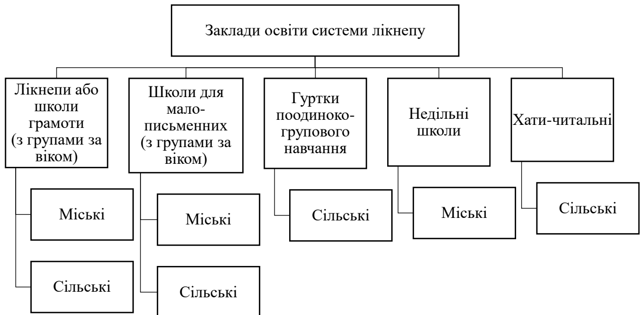
Схема створена на основі напрацювань В. Гололобова [176, с. 33] та доповнена дисертанткою за результатами проведеного дослідження.