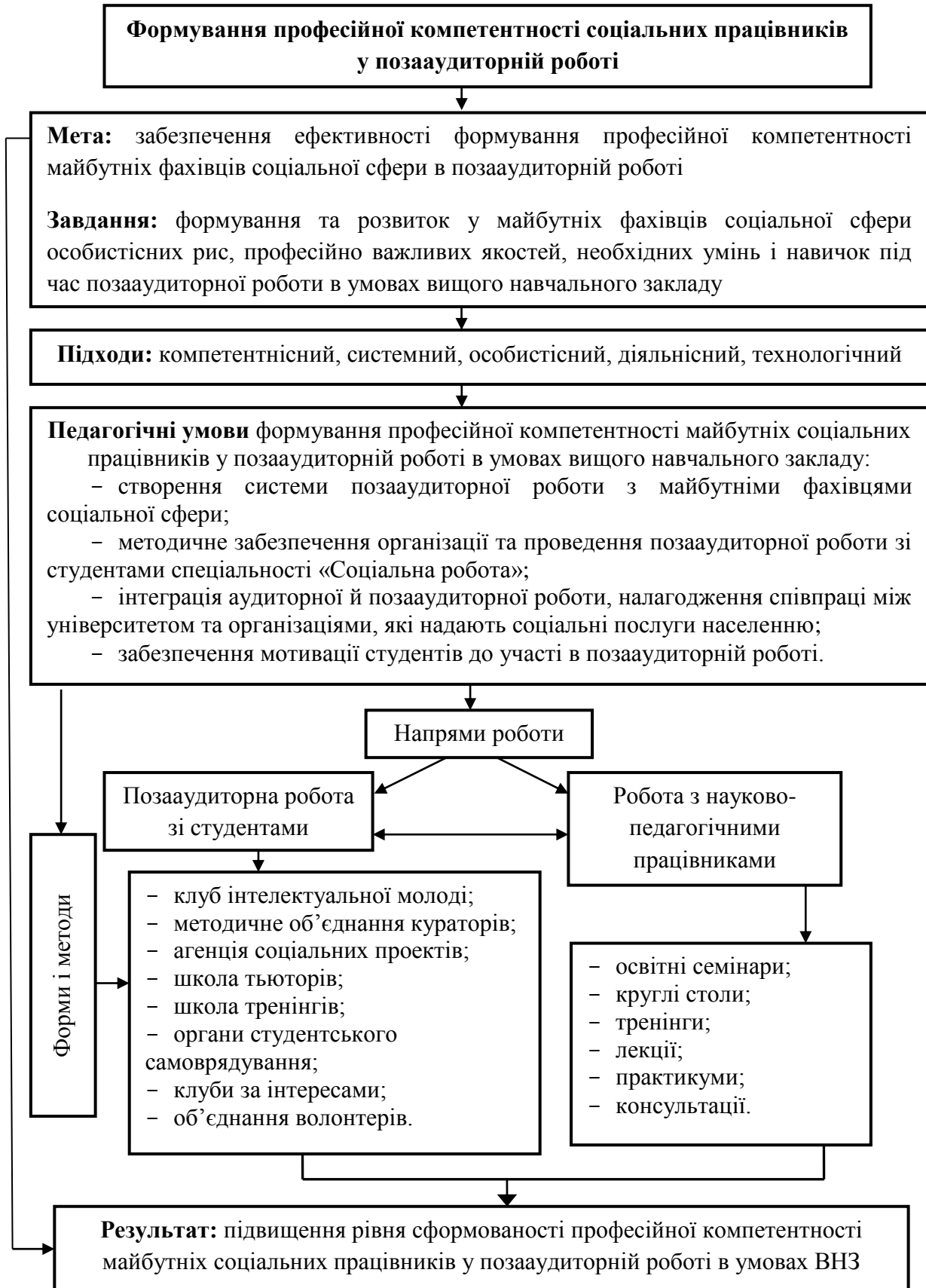
Рис. 1. Структурно-функціональна модель формування професійної компетентності майбутніх соціальних працівників у позааудиторній роботі