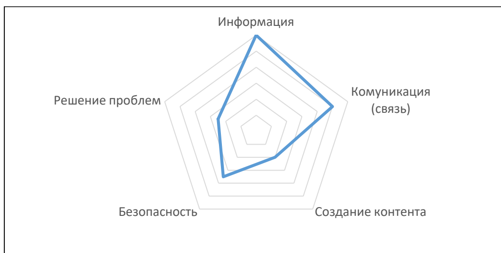
Рисунок 2. Распределение полученных баллов респондентами по компонентам Figure 2 Distribution of points received by respondents by components

Цифровая компетентность может формироваться по-разному и осуществляться в разных аспектах повседневной жизни. Использование Интернета для общения, поиска, скачивания и создания контента, для решения технических проблем, для покупок и платежей – все это разные возможности и, соответственно, для их реализации необходимы разные ресурсы. Как базовый уровень в цифровом развитии, так и высокоспециализированный может быть как общим (во многих сферах деятельности), так и частичным (в отдельных областях). Поэтому, при исследовании цифровой компетентности важно изучить ее компоненты и сферы, в которых каждый из компонентов может получать специфическое развитие и реализацию.