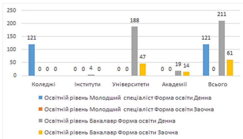
Рис. 1 Кількість студентів спеціальності 015 Професійна освіта (Технологія виробів легкої промисловості)

Особливості та можливості змішаного навчання, на нашу думку, перебувають у безпосередньому зв'язку. Вони дозволяють визначити функціональний потенціал, спрямованість використання інновації з урахуванням специфіки цільової аудиторії, наявності умов тощо. Узагальнюючи результати аналізу вітчизняних та закордонних публікацій, присвячених теоретичним та практичним аспектам змішаного навчання, було визначено ряд можливостей.