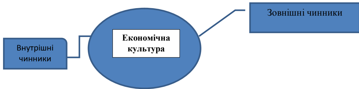
Рис. 1. Чинники впливу на економічну культуру майбутнього фахівця

Під дією цих чинників також формуються процеси, що змінюють організацію та структуру соціокультурного середовища індивіда, розвиваючи конкурентоспроможність, ефективність його діяльності, уміння розуміти залежність від стороннього впливу та забезпечення реагування та адаптації до каталізаторів змін. Водночас прийняття особистістю професії та включення в процес її освоєння є вихідною точкою відліку формування професійного розвитку фахівця, який включає в себе усвідомлення сенсу професії, формування та професійне дозрівання, формування професійної культури, економічної культури, саморозвиток і самовдосконалення суб'єкта праці – учасника ринкових відносин [1].