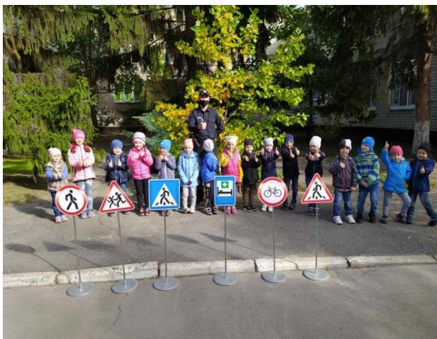
Фото матеріал щодо проведеної роботи під час проєкту