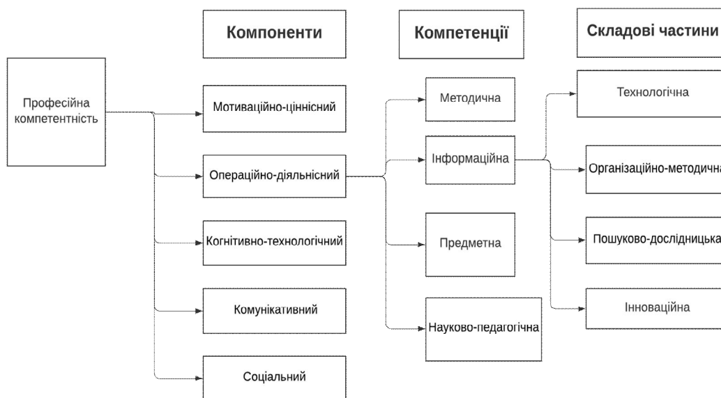
Рис. 1. Структура професійної компетентності майбутнього вчителя (за В. Чорноус, Л. Морською)

Поряд із вітчизняними вченими класифікацію видів професійної компетентності вчителя досліджують і зарубіжні науковці, які її представляють як поєднання ключових компетентностей (key skills) з серцевинними (core skills), базовими (base skills) та широкопрофільними (trans-ferable competences).