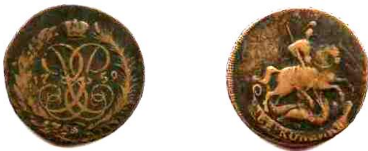
Дві копійки, мідь, Єлизавета Петрівна (1741–1761), 1758 р.

Так, у 1887 р. в с. Будища Кролевецького повіту Чернігівської губернії було знайдено скарб із 189 мідних російських монет номіналом в 2 та 5 копійок: Єлизавети Петрівни (1741–1762) – 2 копійки 1758, і 5 копійок 1758 (ММ) – 3 екз., 1759 – 3 екз., 1760 – 2 екз., 1761 – 6 екз.; Катерини II (1762–1796) – 5 копійок 1762 – 1 екз., АМ 1791 – 1 екз., ЕМ 1763 – 8 екз., 1764 – 10 екз., 1765 – 6 екз., 1766 – 7 екз., 1767 – 8 екз., 1768 – 5 екз., 1769 – 8 екз., 1770 – 10 екз., 1771 – 13 екз., 1772 – 6 екз., 1773 – 11 екз., 1774 – 3 екз., 1775 – 8 екз., 1776 – 7 екз., 1777 – 3 екз., 1778 – 9 екз., 1779 – 6 екз., 1780 – 4 екз., 1781 – 6 екз., 1782 – 5 екз., 1783 – 5 екз., 1785 – 5 екз., 1786 – 1 екз., 1787 – 3 екз., 1788 – 4 екз., 1790 – 1 екз., ММ – 1763 – 2 екз., 1765 – 3 екз., 1788 – 1 екз., СПМ 1763 – 1 екз., СМ – 1766 – 2 екз.