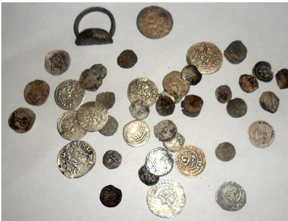
Частина Лисогірського скарбу (2011 р.) монет і печатка XIII – XV ст. Юринецький скарб (2010 р.) європейських монет XV – початку XVII ст. із Городецького району Хмельницької області