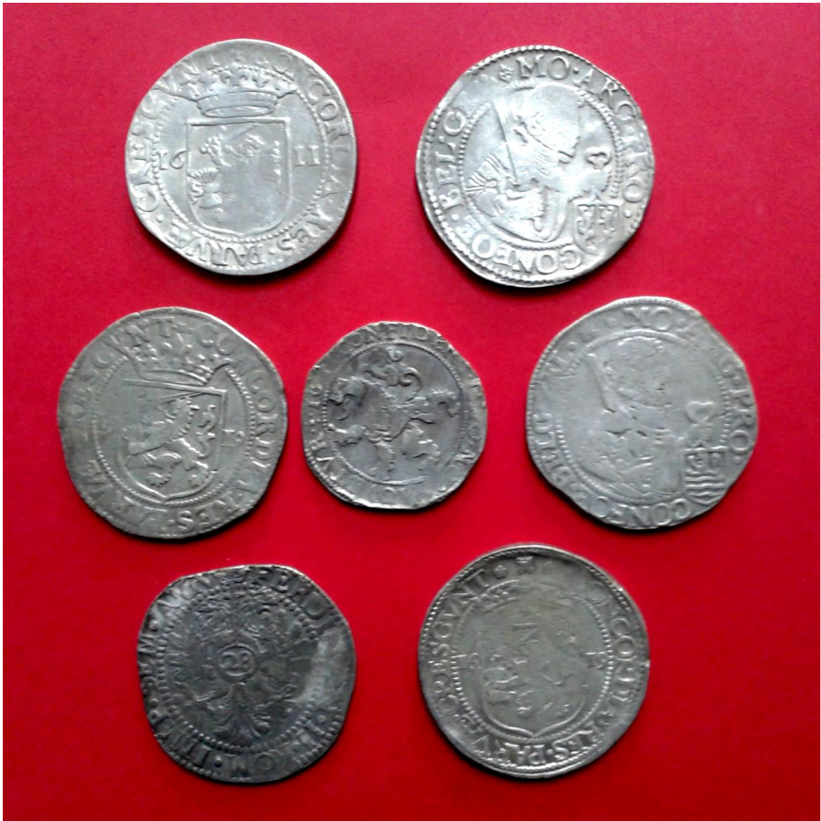
Срібні талери, флорин і півталер XVII ст. із Велико-Бушинкого скарбу Немирівського р-ну Вінницької області