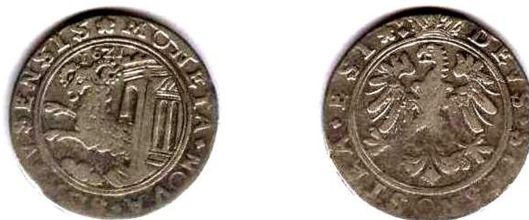
Талер, Швейцарія, кантон Шафхаузен, 1621 р., 27,1 г