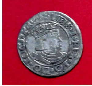
Гріш Сигізмунда I Старого (1506–1548), Данциг, 1531 р.