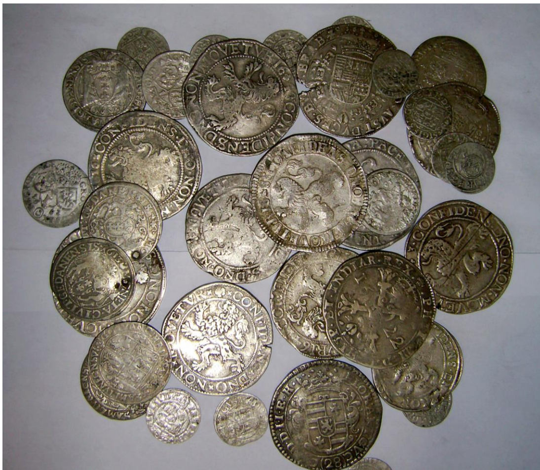
Білківський скарб срібних західноєвропейських монет (2004 р.)