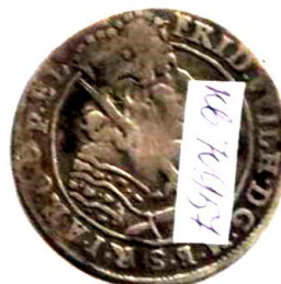
Орт, Пруссія, Фрідріх Вільгельм (1657–1688), 1665 (1685)