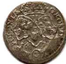
Шостак Яна Собеського (1674-1696), 1679 р., 3 г