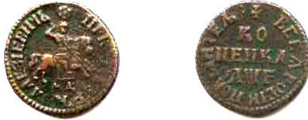
Копійка, мідь, Петро I (1682–1725), 1705 р.

Святий Георгій Переможець (Єгор Хоробрий) народився в Малій Азії у Хетському царстві в 284 р. Займаючи високе соціальне становище, Георгій добровільно склав із себе військові обов'язки і сан для того, щоб стати християнським проповідником. За це він у 305 р. був підданий жорстоким тортурам і страчений.