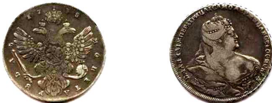
Рубель, Росія, Анна Іванівна (1730 –1740), 1738 р.

У с. Свідня Кролевецького повіту у 1903 р. в землі було відкопано глиняний горщик із 700 срібними московськими і російськими копійками XVII – початку XVIII ст. і 7 рублями першої половини XVIII ст. – Петра I, Катерини I, Петра II, Анни Іванівни та Єлизавети Петрівни. Вага скарбу становила близько 545 г. [1, с. 358]