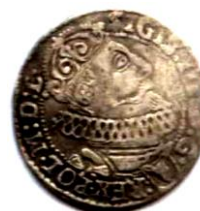
Шостак, Річ Посполита, Сигізмунд III (1587–1632), 1623 р.