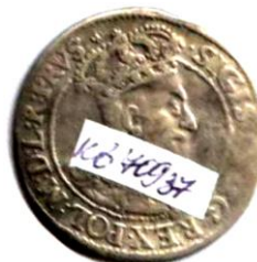
Орт м. Гданська, Річ Посполита, Сигізмунд III (1587–1632), 1617 р.