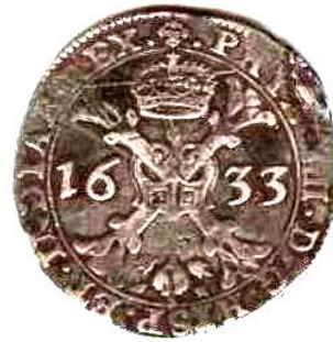
Альбертугалер, 1633 р., Голландська республіка, провінція Брабант, 28,1 г