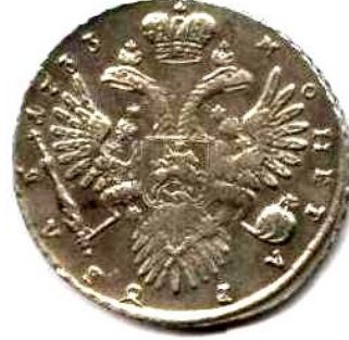
Рубель, Росія, Анна Іванівна (1730 –1740), 1733 р.