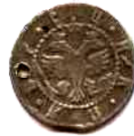
Гривна (10 коп.), Росія, Петро I (1682 –1725), 1704 р.