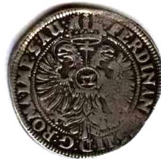
Флорин, Священна Римська імперія, Гамбург, 1621 р., 20,9 г