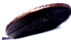
Гурт мідної копійки (ланцюжковий)