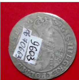
Срібні коронні орти Сигізмунда III (1587–1632) 20-х рр. XVII ст.