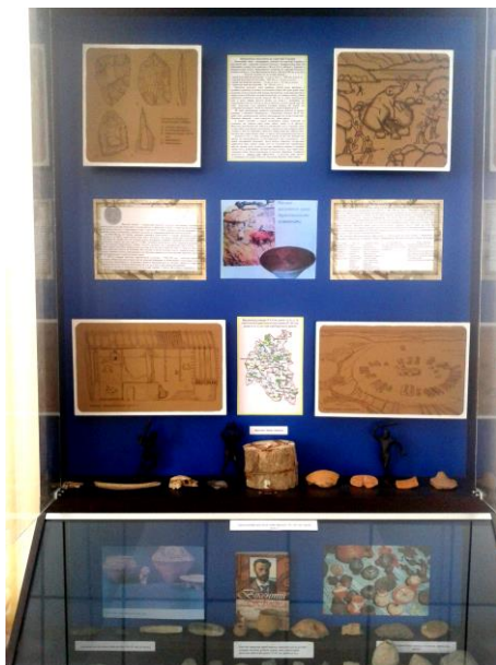
Експозиція Барського районного історичного музею, присвячена пам'яткам неоліту (VI–V тис. до н.е.) та енеоліту (IV–III тис. до н.е.).