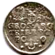
Срібний трояк Сигізмунда III (1587-1632), 1621 р., 1,8 г