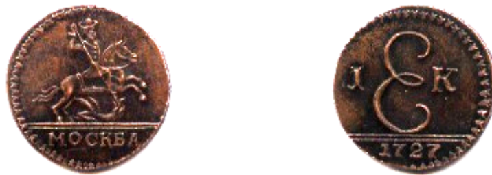
Копійка, мідь, Катерина I (1725– 1727), 1727 р.

У 2010 р. в передмісті м. Кременчука була знайдена дуже рідкісна мідна монета – 1 копійка Катерини I 1727 р. карбування. На аверсі монети зображений Георгій Переможець на коні, під ним напис «МОСКВА», на реверсі – 1 К, вензель – Е (Екатерина), внизу – дата карбування – 1727. Вага монети складає 3,5 г, діаметр – 20 мм. Зображення, написи, вензель, номінал та місце карбування копійки чіткі та виразні. Гурт монети захищений ланцюжковим орнаментом. Навколо краю поля монети з обох сторін розміщений орнамент із випуклих трикутничків. Збереження монети досить добре. Вона практично не перебувала в грошовому обігу.