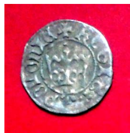
Півгріш Яна Ольбрахта (1492 – 1501), б. д.