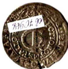
Тимф, Річ Посполита, Ян II Казимир (1648–1668), 1665 р.