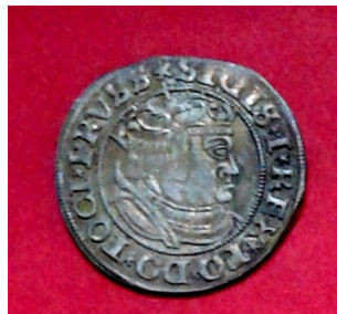
Гріш Сигізмунда I Старого (1506–1548), Пруссія під владою Польщі, 1532 р.