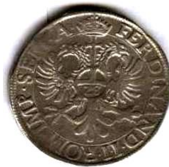
Флорин, Священна Римська імперія, 1621 р., 20,9 г