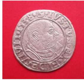
Прусський гріш Альбрехта II (1525–1568 (Пруссія, лен Польщі), 1538 р.