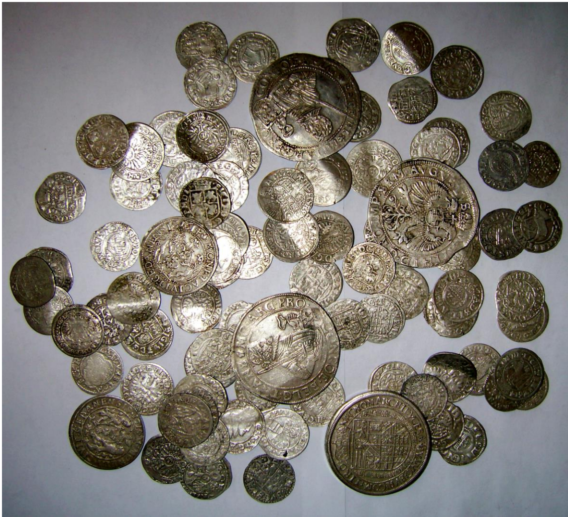
Скарб срібних західноєвропейських монет XVI–XVII ст. (2007 р.) с. Сатанівська Слобода Городоцького району Хмельницької області