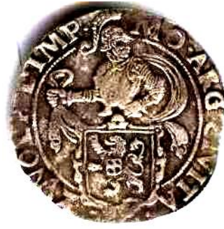
Левковий талер, 1633 р., Голландська республіка, провінція Зволле, 27,0 г