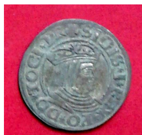
Гріш Сигізмунда I Старого (1506–1548), Данциг, 1534 р.