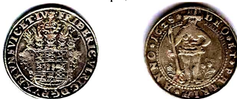
Талер Брауншвейга, 1628 р., 28,9 г