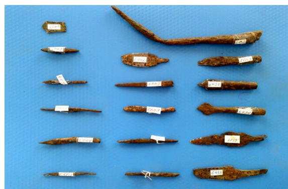
Металеві вироби черняхівських поселень Залізні наконечники для стріл, списа із поселення «Золотий ключ»

Феномен черняхівської культури з її «цивілізованістю», чисельністю та заможністю (про що свідчить велика кількість бронзових прикрас, залізних виробів із майже 10 черняхівських поселень, знайдених в різний час на території нашого краю), пояснюються