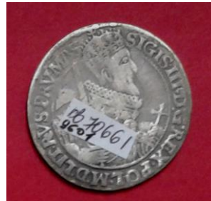
Срібний коронний орт Сигізмунда III (1587–1632) із Велико-Бушинкого скарбу