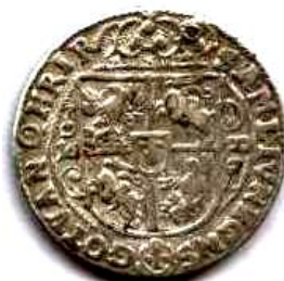
Орт Сигізмунда III (1587-1632), 1620 р., 6,7 г