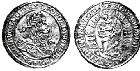
Угорщина, Леопольд I (1657–1705), 10 дукатів, 1687 р.

Пізніше таке зображення часто зустрічається на мадонталях імператриці Марії Терезії (1740-1780) 1742, 1746, 1754, 1765, 1767, 1775, 1778 років, які карбувалися для Угорщини на монетному дворі в Кремінці. Зображення Мадони часто зустрічається також на монетах Баварії, Ватикану, Венеції, Гамбурга, Любека та ін.[6,с. 30; 8, с.33].