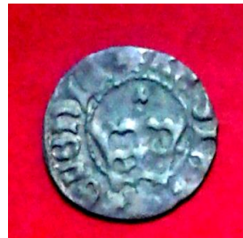
Півгріш Казимира Великого Ягеллончика (1447–1492), б.д.