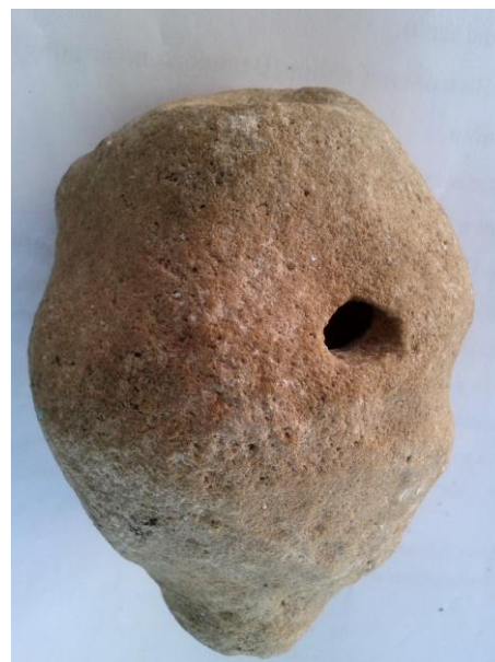
Кам'яна ритуальна фігурка людини (з отвором в середині та збоку) доби Буго-Дністровського неоліту (VI–V тис. до н.е.) із с. Верешки Барського району