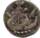
5 копійок, Росія, Єлизавета Петрівна (1741 –1761), 1757 р.