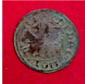
Гріш Сигізмунда I Ягеллончика (1506–1548), Велике князівство Литовське, 1535 р.