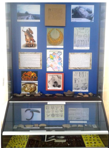
Експозиція Барського районного музею, присвячена скіфській добі, черняхівській та вельбарській культурі (II – III ст. н.е.)