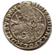
Орт коронний, Річ Посполита, Сигізмунд III (1587–1632), 1622 р.