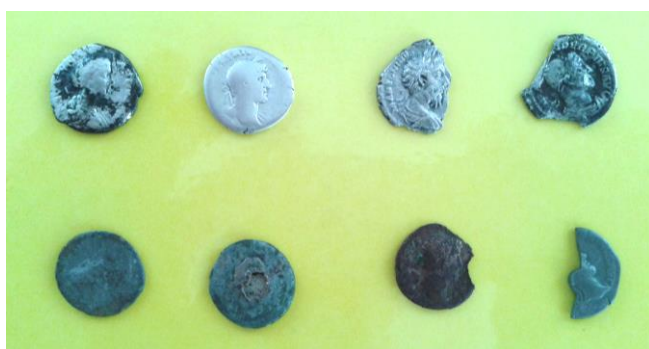
Римські монети, виявлені в урочищі «Золотий ключ»

Про зародження товарно-грошових відносин, майнової нерівності в нашому краї у II – IV ст. свідчать знайдені поряд із іншими металевими виробами римські срібні денарії (чи їх фрагменти) римських імператорів – Доміціана (69–96) діаметром 20 мм, вагою 2 г, Антонія Пія (138–161) діаметром 18 мм, вагою 1,8 г, Фаустини Августи (156–175) діаметром 18 мм, вагою 2,7 г, Луціли (161–165 рр.) діаметром 18 мм, вагою 2,7 г., Марка Аврелія (161–180) діаметром 18 мм, вагою 1,7 г, ½ денарія Дідія Юліана (193) темно-сірого кольору, бронзовий квадранс (1/4 аса) із пробитим отвором посередині. Більшість монет зіпсовані, мають надщерблення, зламані, вкриті патиною тощо.