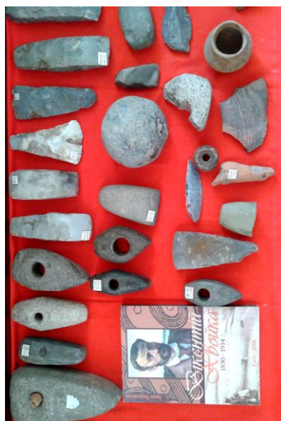
Кам'яні знаряддя праці та гончарні вироби трипільської культури