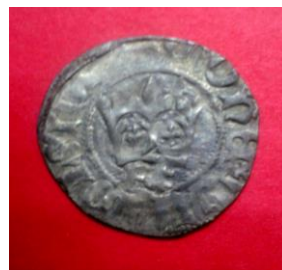
Півгріш Олександра Ягеллончика (1501 – 1506), б. д.