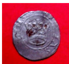
Свідницький півгріш Священної Римської імперії короля Людовіка II, 1526 р.