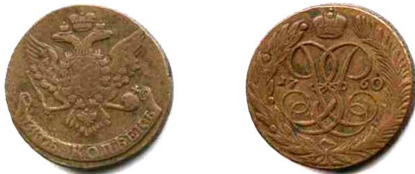
П'ять копійок, мідь, Єлизавета Петрівна (1741–1761), 1760 р.

Найстаріша монета будищинського скарбу – 2 і 5 копійок 1758 р. Єлизавети Петрівни, наймолодша – 5 копійок 1791 р. Катерини II. Тобто період накопичення скарбу становить 33 роки. У скарбі домінують п'ятикопійчники, їх у комплексі нараховується 188 (99,47%), переважно карбування часів правління Катерини. Враховуючи те, що одна п'ятикопійчна монета важила 50 г міді, а дві копійки – 20 г, то не важко підрахувати, що вага скарбу становила 9 кг 420 г. [1, с. 354–355].