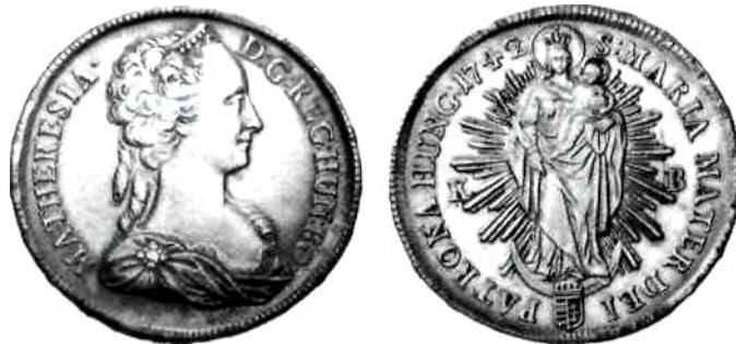
Мадонталяр Марії Терезії 1742 р.

Пізніше таке зображення часто зустрічається на мадонталях імператриці Марії Терезії (1740-1780) 1742, 1746, 1754, 1765, 1767, 1775, 1778 років, які карбувалися для Угорщини на монетному дворі в Кремінці. Зображення Мадони часто зустрічається також на монетах Баварії, Ватикану, Венеції, Гамбурга, Любека та ін.[6,с. 30; 8, с.33].