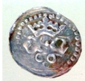
19. Подільське князівство, Федір Коріатович (1388- 1394), подільський денарій.