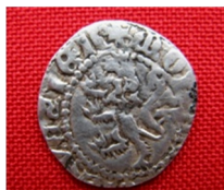
3. Польське королівство, Казимир Великий (1333-1370), галицько-руський грошик м. Львова.