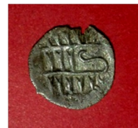
14. Золота Орда, хан Джанібек (1341-1357), срібний дирхем б.д.