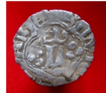
м. Хмельницький, 2016 р. Вага 1,01г, діаметр 18 мм