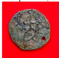
с. Горбівці Літинського р-ну Вінницької області, 2011 р.