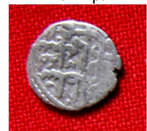
м. Хмельницький, 2016 р.