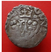
с. Павлівка Тальнівського р-ну Черкаської обл., 2016 р. Вага 1.0 г, діаметр 18 мм