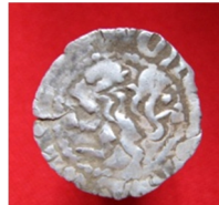
8. Польське королівство, Людовік Угорський (1342-1382), галицько-руський грошик