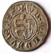
17. Молдавське князівство, Петру Мушата (1374-1391), гріш (м. Сучава).