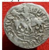
4. Подільське князівство, Костянтин Коріатович (1380-1388/91), подільський полугрошик б. д.