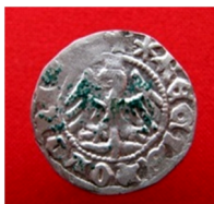
15. Польське королівство, Владислав Ягайло (1386-1434), коронний півгріш б.д.