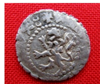
5. Польське королівство, Владислав Опольський (1372-1379), галицько-руський грошик м. Львова.