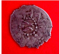
Козятинський р-н Вінницької області, 2014 р.