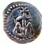
смт Сосниця Чернігівська області. Вага 0,77 г, діаметр 1,2 мм, проба – 600, 1911р.