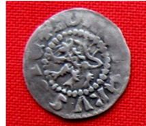
10. Польща, Владислав II Ягайло (1386-1434), кварталник руський