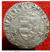
с. Черча Чемеровецький р-н Хмельницької області, 2012 р. Вага 1,19 г, діаметр 17,5 мм, проба – 900.