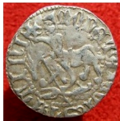
1. Подільське князівство, Костянтин Коріатович (1380-1388/91), подільський полугрошик б. д.