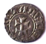
с. Лисогірка Городецького р-ну Хмельницької області, 2011 р.