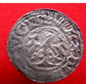
с. Словіта Золочівський р-н Тернопільської області, 2015 р