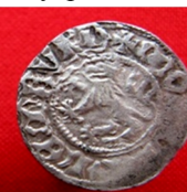
6. Польське королівство, Владислав Опольський (1372-1379), галицько-руський грошик м. Львова 1386 р.