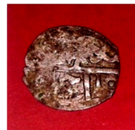
12. Новгород-Сіверське наслідування Дмитра Корибути (1382-1404) джучидським дирхемам б. д.