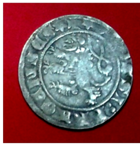
с. Польний Мукарів Городоцького р-ну Хмельницької області, 2011 р. Вага 3,44 г