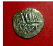
с. Польний Мукарів Городоцький р-н Хмельницької області, 2014 р.