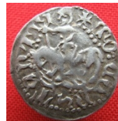
2. Подільське князівство, Костянтин Коріатович (1380-1388/91), подільський полугрошик б. д.