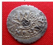
смт. Смотрич Кам'янець-Подільського р-ну Хмельницької обл., 2012 р. Вага 1,25 г