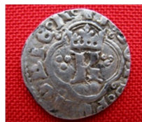
с. Сатанівська Слобідка Городоцького р-ну Хмельницької області, 2012 р. Вага 1 г, діаметр 18,5 мм