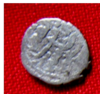
16. Золота Орда, срібний дирхем кінець XIV-початок XV ст.