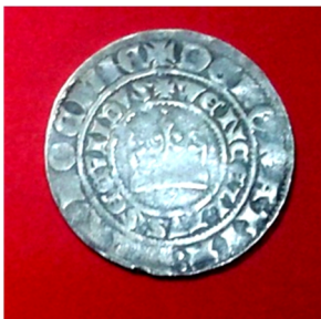
11. Чехія, Вацлав II (1278-1305), празький гріш б. д.