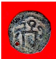
13. Золота Орда, хан Узбек (1313-1341), мідний пул б.д.