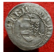
смт Смотрич Кам'янець - Подільський р-н. Вага 1, 02 г, діаметр 18 мм, проба – 900, 2012 р.