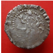
7. Польське королівство, Людовік Угорський (1342-1382), галицько-руський грошик