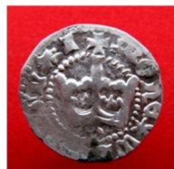
с. Ялтушків Барського р-ну Вінницької області, 2014 р.