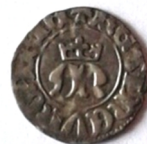
20. Угорське королівство, Марія Угорська (1385-1386), б.д.