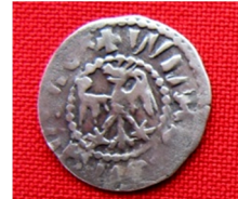
с. Григорівка Могилів-Подільський р-н Вінницької області, 2011 р.