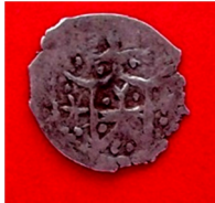
9. Київське князівство, Володимир Ольгердович (1363-1398), срібна монета 80-х рр. XIV ст.