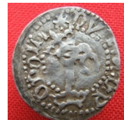
с. Павлівка Тальніцький р-н Черкаської обл., 2016 р. Вага 0,99 г, діаметр 18 мм