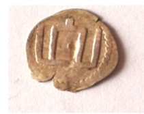
с. Лисогірка Городецького р-ну Хмельницької області, 2011 р.