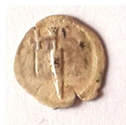
18. Велике князівство Литовське, князь Вітовт (1392-1430), денарій б. д