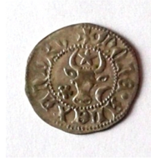
с. Лисогірка Городецького р-ну Хмельницької області, 2011 р. Вага 0,88 г, діаметр 20 мм