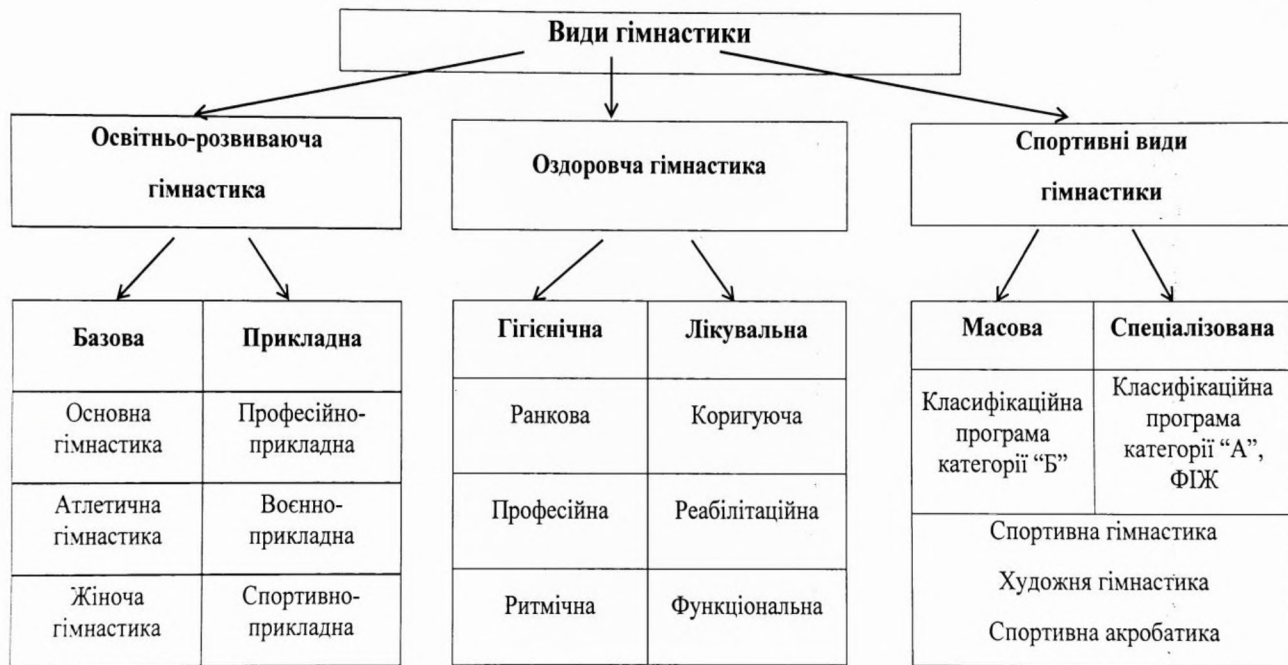
Рис. 1. Види гімнастики (Савченко М., 2005)