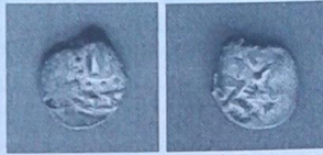
Срібний акче хана Мухаммад-Гірея II Даулат-Гірея I (1577–1584)