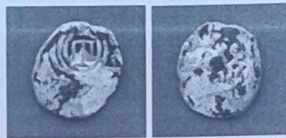
Срібний акче хана Іслам-Гірея II (1584-1588)