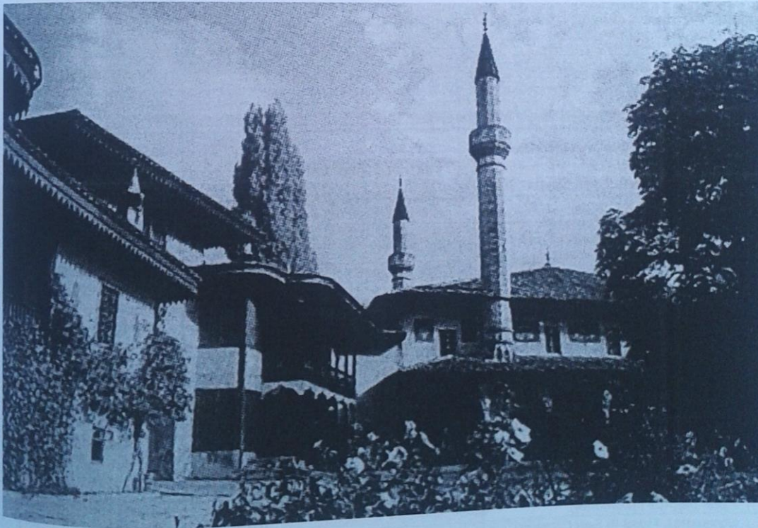
Ханський палац в Бахчисараї XVI – XVIII ст.