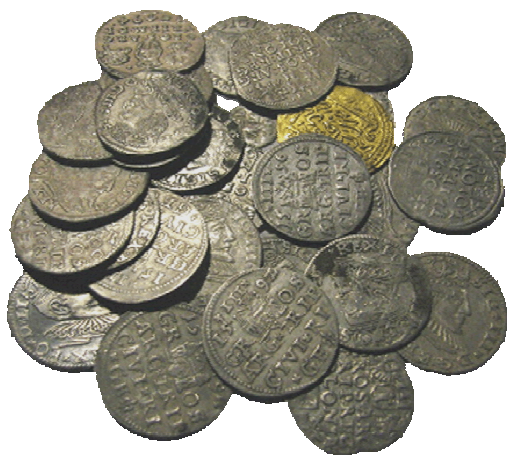
Мал. 3. Річ Посполита, Османська імперія кінця XVI ст., алтун, трояки, шостаки. м. Старокостянтинів Хмельницької області, 2014 р.

Цей період яскраво ілюструє Старокостянтинівський скарб, який нараховує 150 срібну та 1 золоту монети кінця XVI ст. Монетний комплекс виявлений весною 2014 р. на полі поблизу м. Старокостянтинова Хмельницької області. Золотий алтун Османської імперії представлений у скарбі однією монетою з пробитим отвором (вага 3,43 г). У скарбі наявні 10 трояків 1580–1586 рр. короля Речі Посполитої Стефана Баторія (1576–1586), 30 шостаків 1589–1599 рр. та 110 трояків 1587–1599 рр. Сигізмунда III Вази (1587–1632) ранніх випусків. Скарб міг належати місцевому міщанину чи корчмарю (мал. 3).