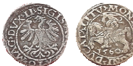
Велике князівство Литовське, Сигізмунд II Август (1548–1576), півгріш 1560 р. Вага = 1,2 г, Д = 19 мм. м. Бар Вінницької області, 2005 р.