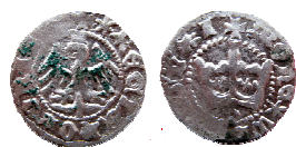
Польське королівство, Владислав Ягайло (1386–1434), коронний півгріш б.д. В=1,6 г, Д=22 мм с. Словіта Тернопільської області, 2015 р.

У 1548–1569 рр., за правління короля Польщі, князя Великого князівства Литовського, а з 1569 р. після Люблінської унії – короля Речі Посполитої Сигізмунда II Августа (1548–1572), на подільському грошовому ринку, поряд із монетами Священної Римської імперії, набувають поширення срібні коронні та литовські трояки, гроші, півгроші та соліди, відкарбовані за часу правління цього короля (мал. 2).