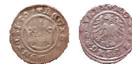
Польське королівство, Сигізмунд I Старий (1506–1548), коронний півгріш 1521 р. Вага = 1 г, Д = 18 мм. м. Тиврів Вінницької області, 2008 р.