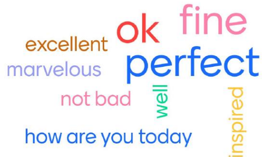
Рис. 1 Приклад використання платформи Mentimeter

Answer garden – це новий мінімалістичний інструмент зворотного зв'язку. Його можна використовувати для участі аудиторії в реальному часі, онлайн-мозковому штурмі та отримання фідбеку.