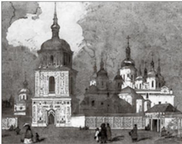
М. Сажин. Софійський собор. 1846