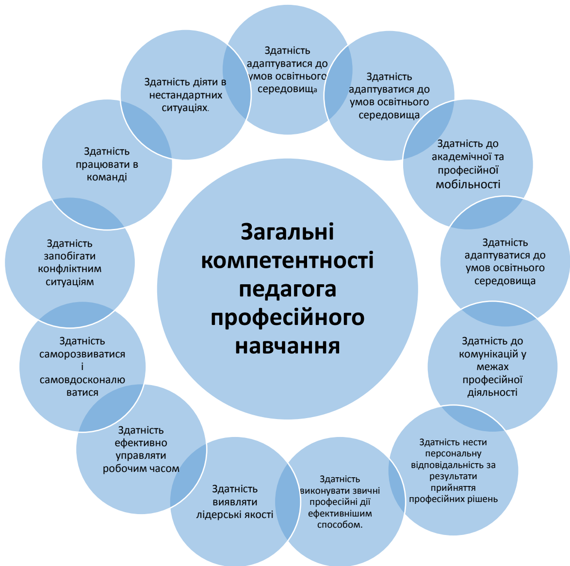
Рис. 4. Загальні компетентності педагога професійного навчання