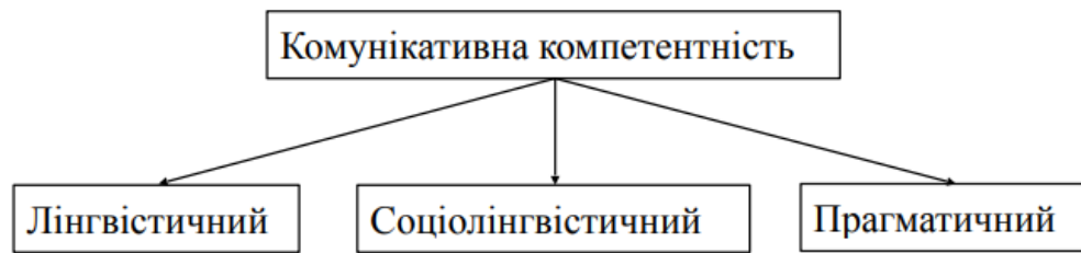
Рис. 1.3. Складові комунікативної компетентності

Лінгвістичний компонент охоплює знання лексики, фонетики, граматики, відповідні навички та вміння, а також інші характеристики мови як системи. В рамках індивідуальної комунікативної компетентності, даний компонент передбачає не тільки обсяг і якість знань (наприклад, знання, обсяг і точність словника), але і їх когнітивну організацію і спосіб зберігання (наприклад, асоціативну мережу, в яку мовець поміщає певну лексичну одиницю), а також їх доступність (пригадування, витяг з довготривалої пам'яті, використання). Знання не завжди носять усвідомлений характер і не завжди можуть бути чітко сформульовані. Соціолінгвістичний компонент являє собою здатність здійснювати вибір мовних форм, використовувати їх і перетворювати відповідно до контексту.