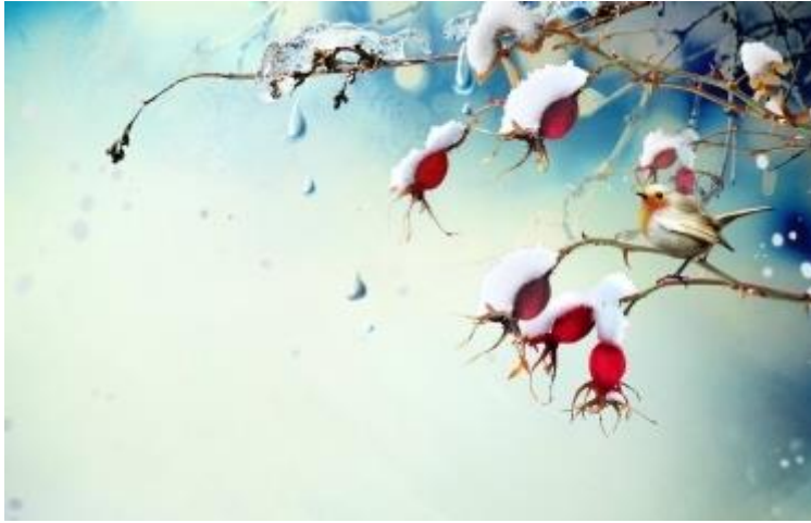
Це фото до твору