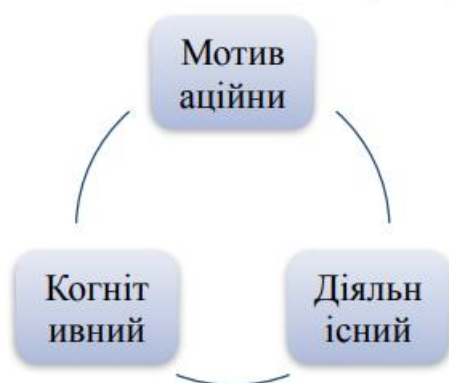
Рис. 1.2. Компоненти комунікативної компетентності

Вдалою є структура комунікативної компетентності, яка визначена О. Васильєвою, де виокремлено взаємопов'язані компоненти: мотиваційний, когнітивний та діяльнісний (див. рис.1.2)