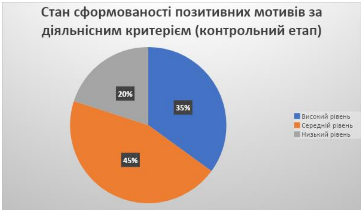
Рисунок 2.4. Стан сформованості позитивних мотивів до читання за діяльнісним критерієм (контрольний етап)

констатувального етапу. Наведемо отримані результати стану сформованості позитивних мотивів до читання за діяльнісним критерієм (рис. 2.4).