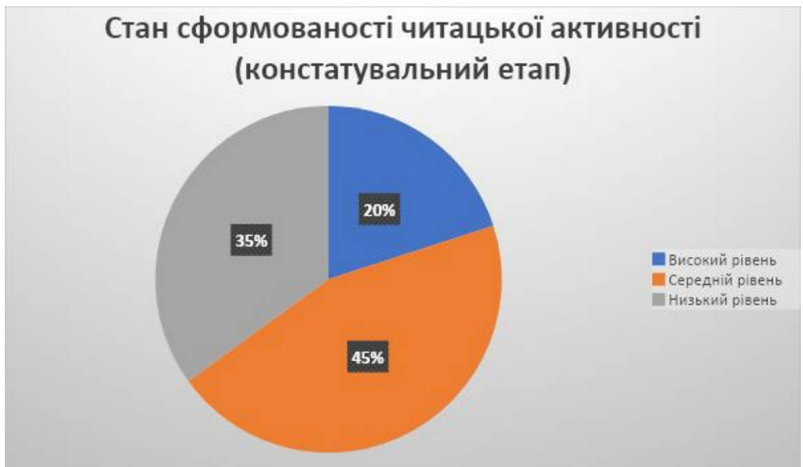
Рис. 2.2. Стан сформованості читацької активності (констатувальний етап)

Під час спостереження було помічено, що діти були досить активними у відповідях і висловлювали їх досить швидко, без глибокого розмірковування. Часто вони ставили додаткові уточнювальні запитання своїм однокласникам та організаторам експерименту. Результати анкетування на виявлення читацької активності першокласників представлені на рис. 2.2.