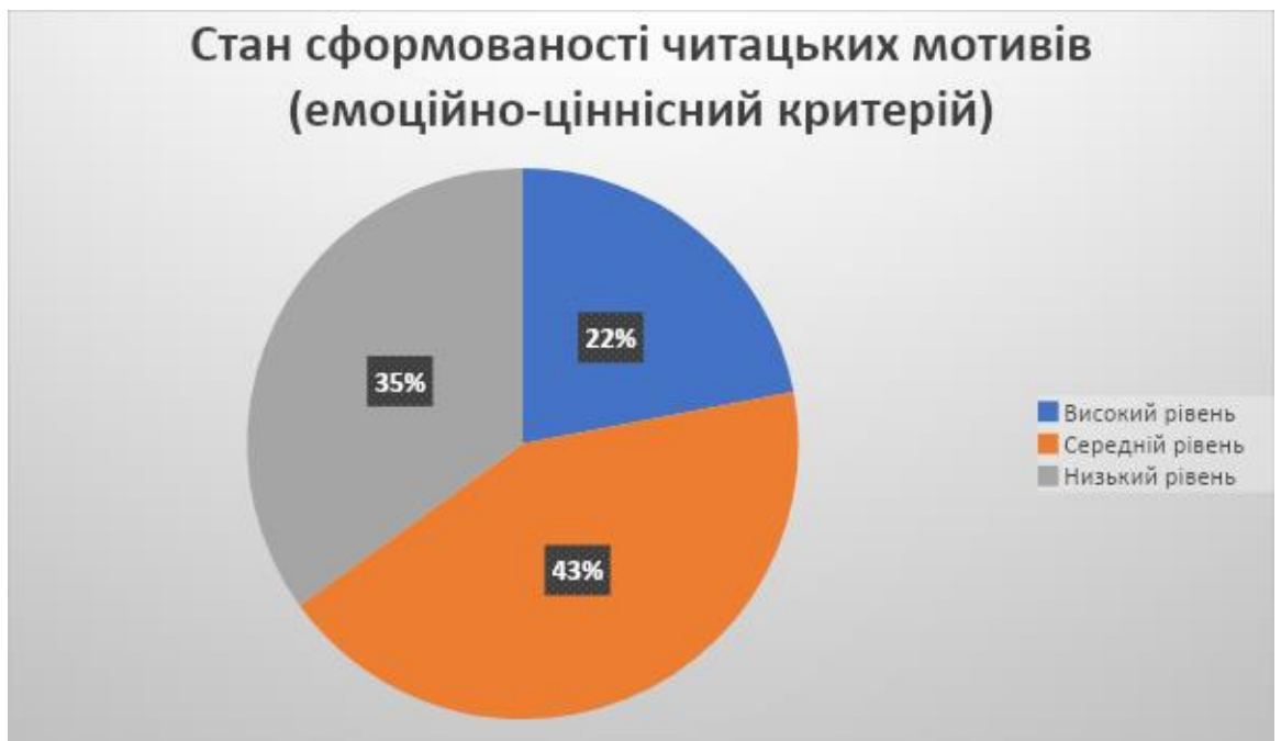
Рисунок 2.3. Стан сформованості позитивних мотивів до читання за емоційно-ціннісним критерієм

Рисунок 2.3. наочно демонструє рівень сформованості позитивних мотивів до читання за емоційно-ціннісним критерієм.