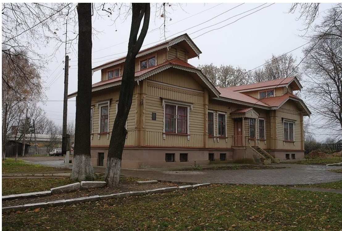
Жіночий корпус земської лікарні (світлина жовтня 2013 року)