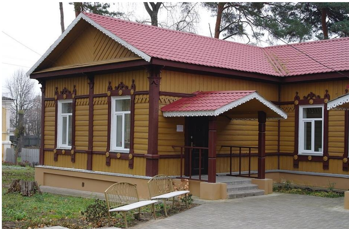
Інфекційне відділення земської лікарні (світлина жовтня 2013 року)