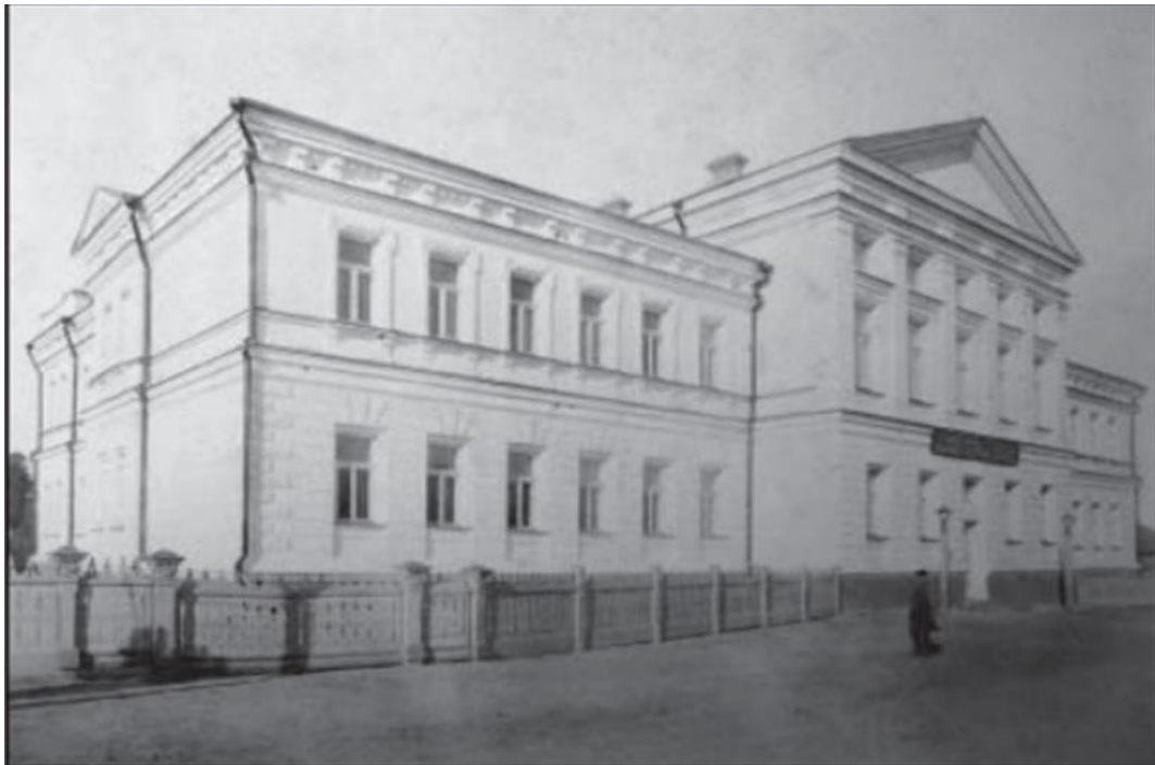
Будинок жіночої гімназії. Фото кінця XIX ст.