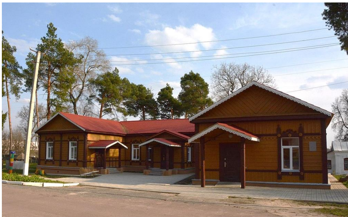
Інфекційне відділення земської лікарні (світлина квітня 2013 року)