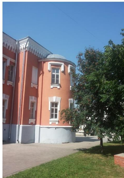
Пансіон Глухівської чоловічої гімназії (сучасне фото)