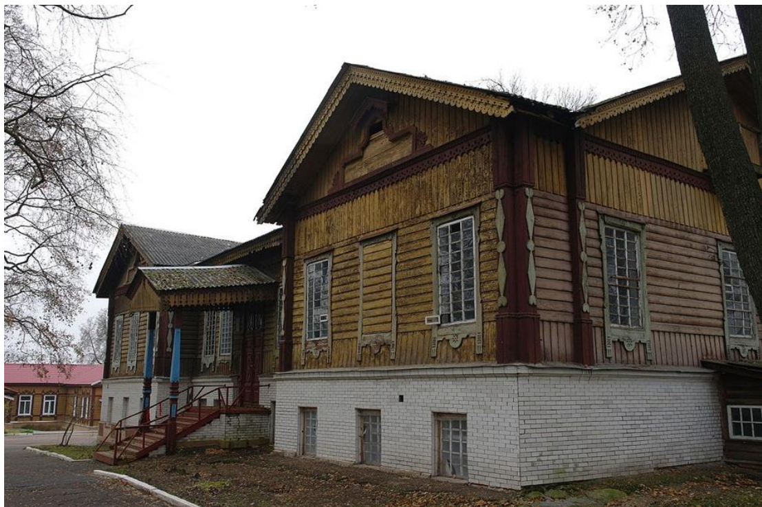
Чоловічий корпус земської лікарні (світлина жовтня 2013 року)