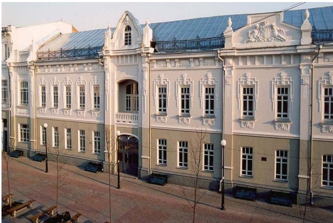
Будинок Глухівського повітового земства (сучасне фото)