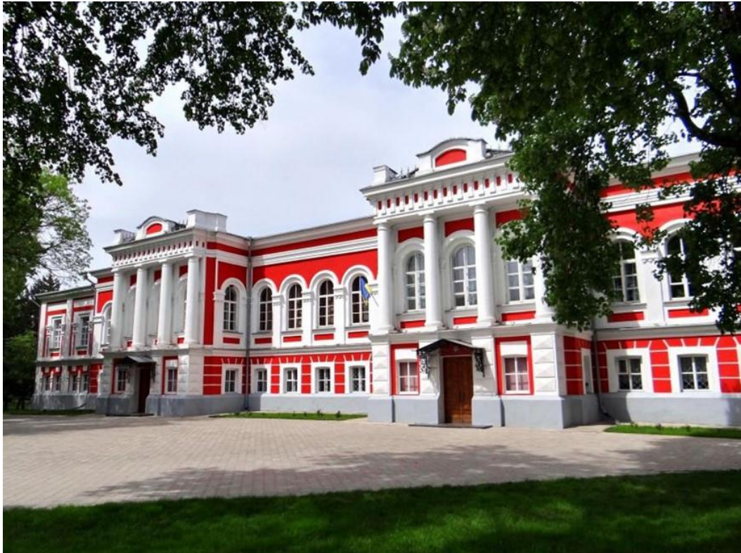
Глухівська чоловіча гімназія (сучасне фото)