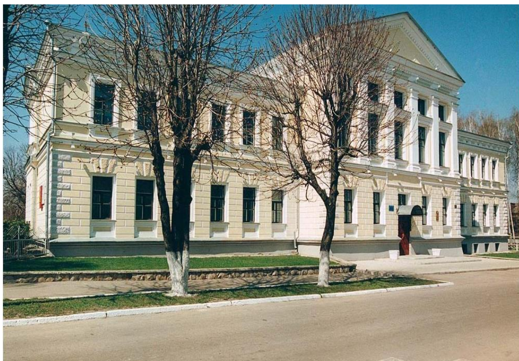
Глухівська жіноча гімназія (сучасне фото)