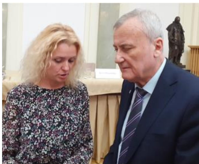
Рисунок 4. Президент Національної академії наук України академік Анатолій Загородній та д.пед.н., проф. Воронова Н., ДДПУ, 02.06.22. Warsaw.

культурних проектів, виставок, фестивалів, майстер-класів та інших заходів, сприяє розвитку освіти та підвищенню кваліфікації українських фахівців у сфері культури, надає можливості для участі у стажуваннях, тренінгах, семінарах та інших освітніх заходах в Європі. Міжнародна програма «House of Europe. Stand with Ukraine. Підтримка від ЄС для українців: сфери культури та освіти» надає фінансову підтримку для реалізації культурних проектів та ініціатив в Україні, спрямованих на розвиток сучасного мистецтва, культурний обмін, збереження культурної спадщини, сприяє розвитку культурної дипломатії та співпраці між Україною та країнами Європейського Союзу, сприяє