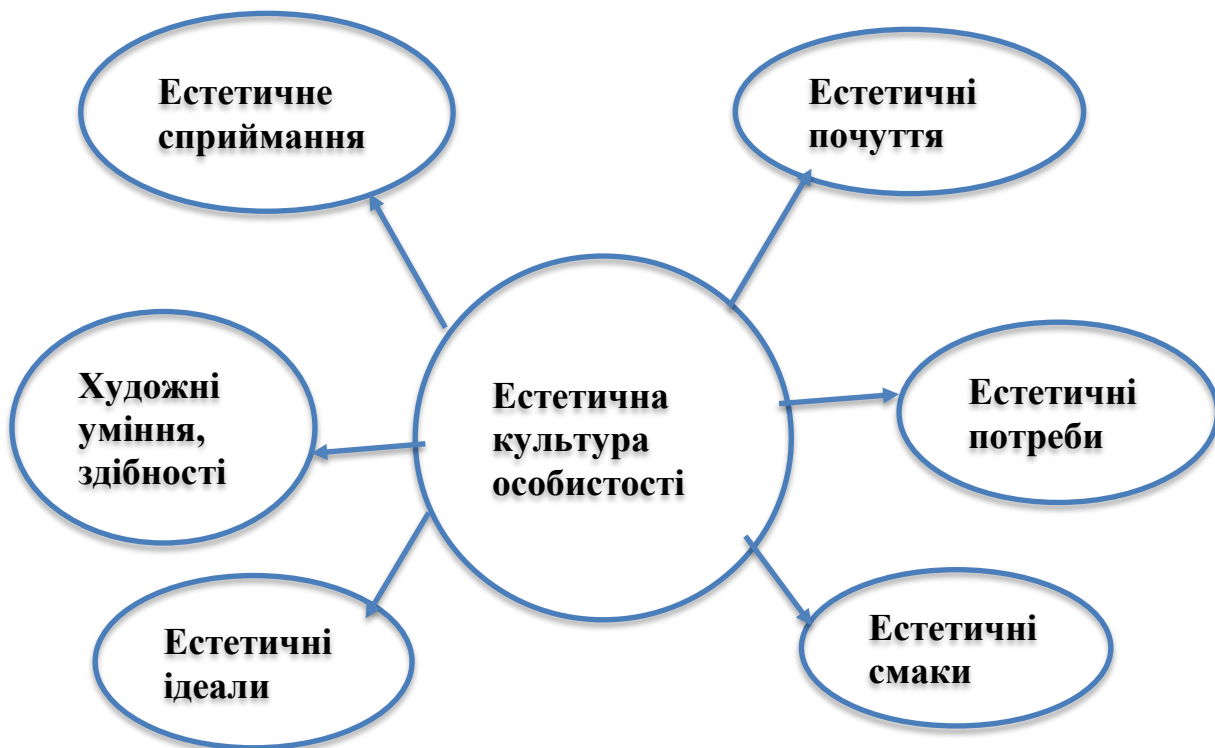
Рис. 1.1. Компоненти естетичної культури [53, с. 46]

На думку Г. Лабковської, узагальнене визначення естетичної культури містить такі компоненти: