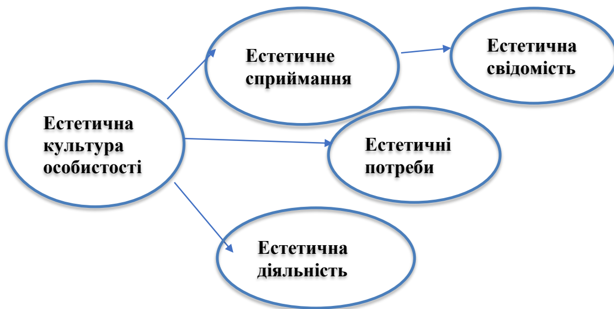
Рис. 1.2. Компоненти естетичної культури особистості [46, с. 214]