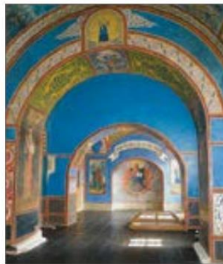
Капела Івана Мазепи в Софії Київській. Сучасний вигляд