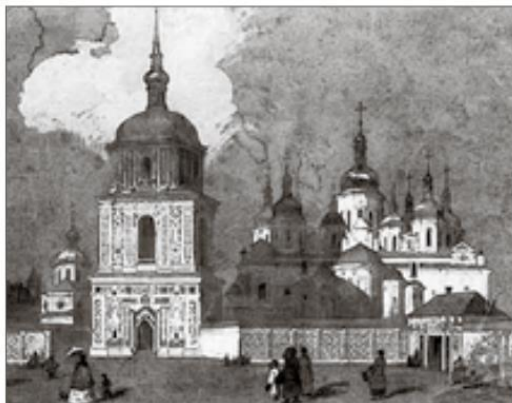
М. Сажин. Софійський собор. 1846