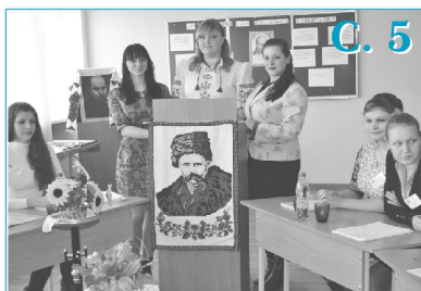
Проведення круглого столу "Тарас Шевченко і світова література"