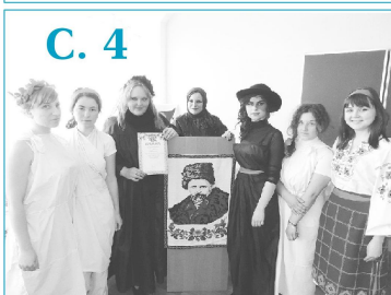
Конкурс акторської майстерності "Шевченкіана театральна"