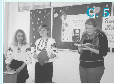
Виховна година на факультеті природничої та фізико-математичної освіти