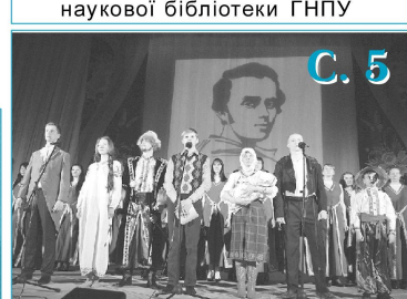
Концерт пам'яті Тараса Григоровича Шевченка "Ми чуємо тебе, Кобзарю, крізь століття!"