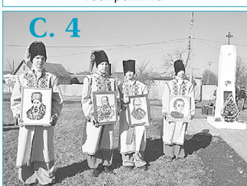
Ушанування пам'яті геніального поета