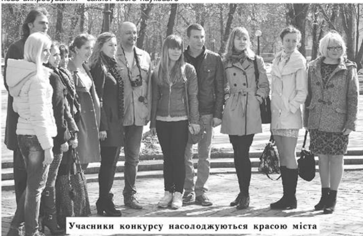
Учасники конкурсу насолоджуються красою міста

Трофейна скарбничка цього скромного хлопця налічує і без того багато перемог, але ми бажаємо йому нових і нових звершень!