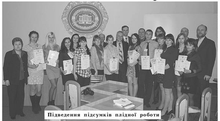
Підведення підсумків плідної роботи

Щиро вітаємо учасників і переможців конкурсу, а також їхніх наукових керівників. Нових вам звершень та відзнак!