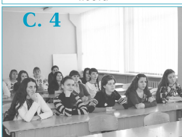
Проведення кінолекторію "Мій Шевченко"

У кожного народу є особистості, імена яких вписані в історію золотими літерами. Саме так можна сказати про Тараса Шевченка, чия безсмертна спадщина - одна з найбільших вершин людського генія. Іван Франко писав: "Він був сином мужика і став володарем у царстві духа. Він був кріпаком і став велетнем у царстві людської культури. Він був самоуком і вказав нові, світлі і вільні шляхи професорам і книжним ученим.