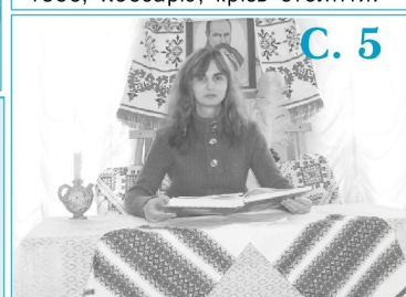
Шевченківські дні у професійно-педагогічному коледжі ГНПУ