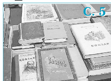
Виставка творів Тараса Григоровича Шевченка, підготована працівниками наукової бібліотеки ГНПУ