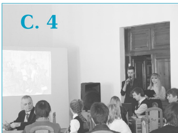
Проведення науково-просвітницької конференції "Святої правди голос новий"