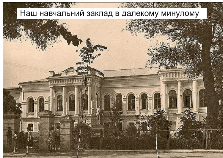
Наш навчальний заклад в далекому минулому