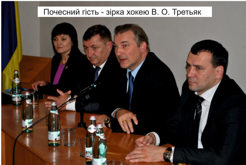
Почесний гість - зірка хокею В. О. Трет'як

Для нашого навчального закладу ювілейний рік знаменний і суттєвим реформуванням вищої освіти в державі.