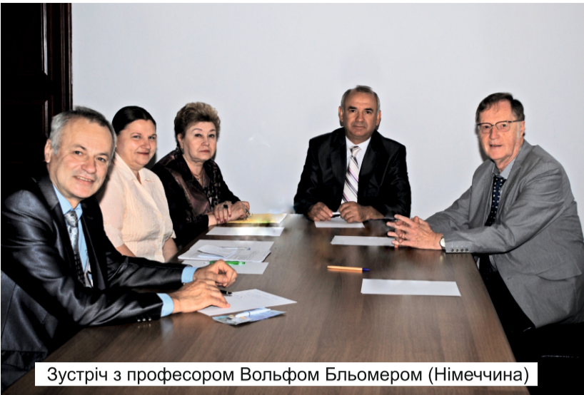
Зустріч з професором Вольфом Бльомером (Німеччина)

акредитації (сертифікат серії РД- IV № 1926587, термін дії до 01 липня 2024 року).