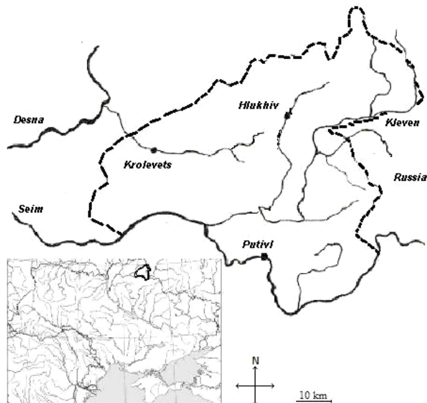
Рис. 1. Картографічне розташування Придеснянського плато в межах Кролевецько-Глухівського геоботанічного району

гупсх, 1988). Західні відроги Середньоруської височини, що проникають із території Росії, утворюють так звані Придеснянські відроги, які, у свою чергу, поділяються на три частини: Ямпільський, Глухівсько-Кролевецький, Путивльський. Регіон нашого дослідження розташований у межах Глухівсько-Кролевецького та Путивльського відрогів. Це область підвищеного плато (Придеснянське плато, далі ПП) із найвищими висотами 224–230 м над рівнем моря (північніше Глухова) та найменшими висотами 130 м над рівнем моря в заплавах річок.